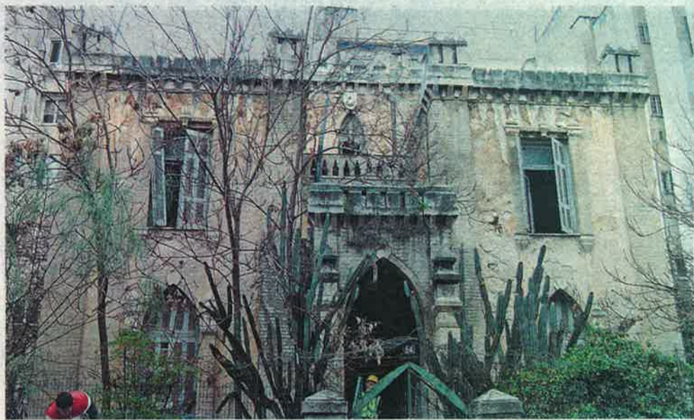
Την εβδομάδα που μας πέρασε ξεκίνησαν η εκκένωση και ο καθαρισμός του Πύργου της οδού Θήρας.