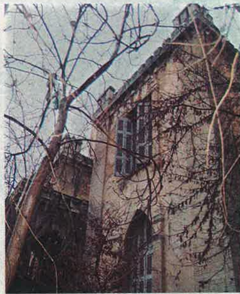
Ο Πύργος της οδού Θήρας είναι ένα από τα σπάνια δείγματα εφαρμογής του νεογοτθισμού.