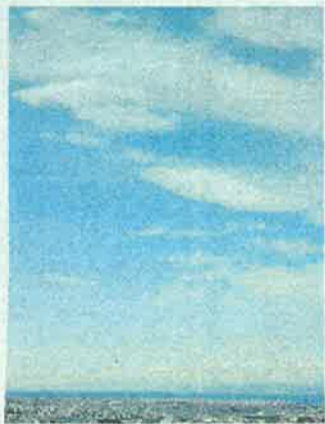
Μιλώντας για την Αθήνα με ανθισμένα ταξίδια. Στο Πνευματικό

Ενδιαφέρουσα πρωτοβουλία: Ολων, μέσω του προγράμματος «ΕΡΕΥΝΑ» σε συνεργασία με το δίκτυο «ΣΥΝΕΡΓΩΝΕΙ» ένα πρόγραμμα άμεσων πόντων αστικού χώρου και στην εμπλοκή του κέντρου της πόλης. Στο πρόγραμμα είναι να προβάλλει στους χώρους του κέντρου, προστόχρονα έδαφος για πειραματισμικούς πυρήνες και συλλογική πόλη. Η αρχή γίνεται από τη Σοφία, στην οδό Βουλής 9. Είναι έβρισκεται σε κατάσταση αδράνη πολλά χρόνια, καθώς τα περισσότερα της δεν λειτουργούν. Οι κειστοάς για ένα μήνα θα μετατραπεί εργαστήριο παραγωγής νέων δραστηριοτήτων και εικαστικών ιδεών που θα επιδημιουργήσει της πόλης μέσω απόλυτα συμμετοχική διαδικασία απευθυνθεί ανοιχτή πρόσκληση δημιουργούς, καλλιτέχνες, αρχιτεκτονικά δίκτυα, πολυδιάστατες